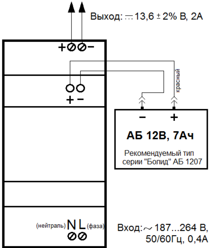
Схема подключения МИП-12 исп.100 (МИП-12-2/7П10)