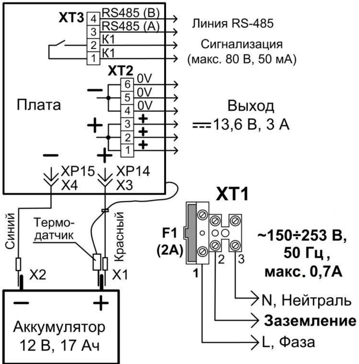
Схема подключения РИП