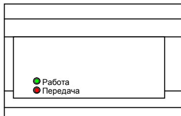
Рис. 1. Внешний вид передатчика (надписи показаны условно)