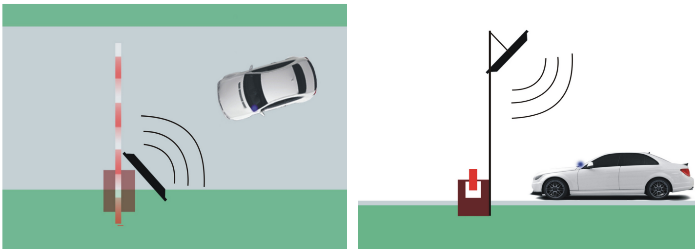
Рис. 2 ( Gate-UHF-Mono-12)