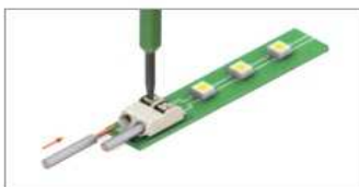
Кабель с многопроводной жилой вставляется после нажатия на фиксатор клеммы.