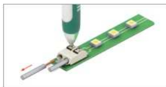
Любой кабель отсоединяется после нажатия на фиксатор клеммы.