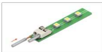
Кабель с однопроводной жилой вставляется без инструмента.

Клеммы считывателя позволяют производить быстрое подключение без отвертки. Вы можете использовать кабель с однопроводными или многопроводными жилами общим сечением от AWG24 (0,2мм 2 ) до AWG18 (0,82мм 2 ), например, КСПВ 8x0,5, стандартная витая пара CAT5.