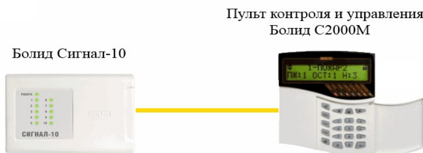
Рис. 1. структура простой системы

Представим себе простейшую охранно-пожарную систему. Всё просто, «Сигнал-10» подключается к «С2000М» по витой паре и всё работает, все шлейфы находятся под охраной. Можно разнести эти блоки вплоть до 1200 метров, всё будет работать.