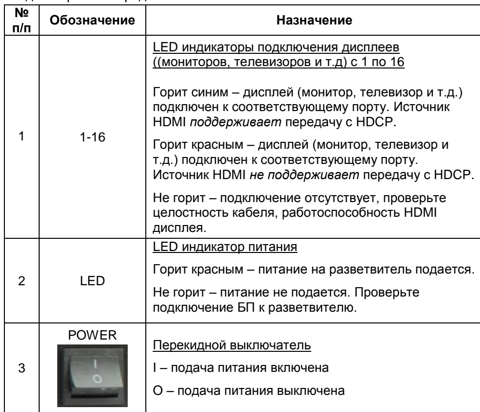
Таб.1 HDMI разветвитель D-Hi1161, назначение разъемов и индикаторов на передней панели