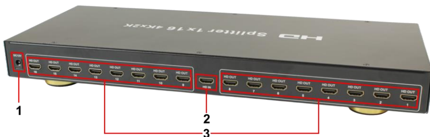
Рис.3 HDMI разветвитель D-Hi1161, разъемы и индикаторы на задней панели