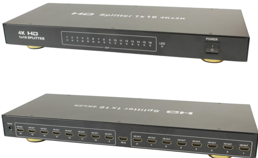
Рис.1 HDMI разветвитель D-Hi1161, внешний вид спереди / сзади