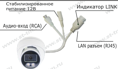
Рис. 1 Схема подключения видеокамеры