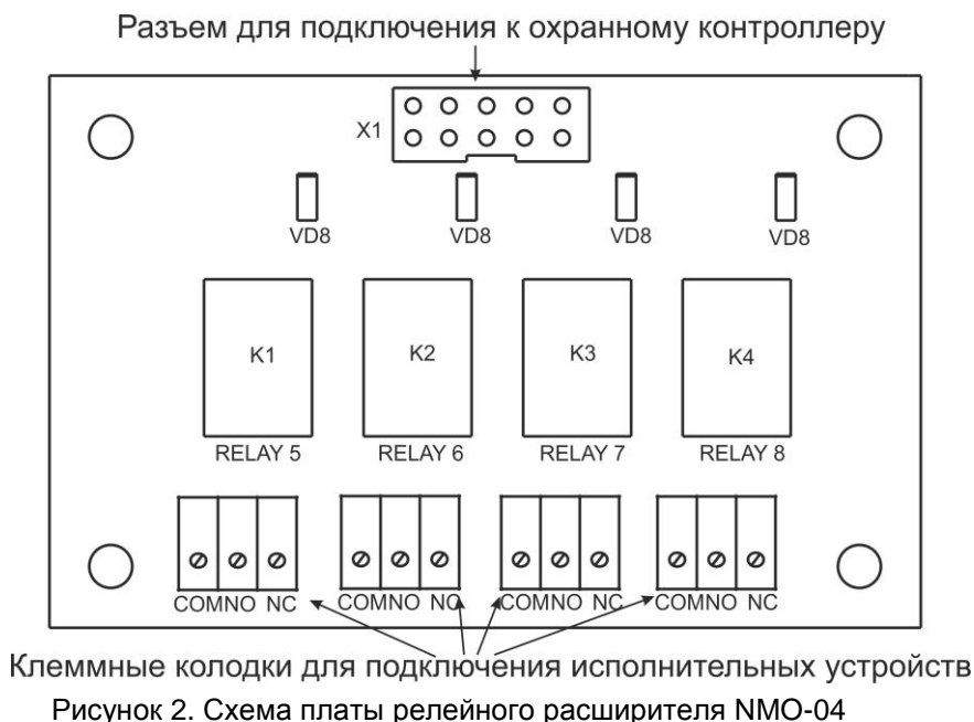
Клеммные колодки для подключения исполнительных устройств Рисунок 2. Схема платы релейного расширителя NMO-04

Срок службы устройства – не менее 8 лет.