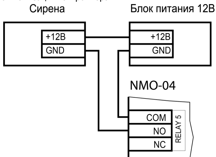
Рисунок 3. Подключение сирены к выходу реле

На рисунке 3 показан пример подключения к выходу реле сирены для подачи тревоги при срабатывании системы сигнализации контроллера.