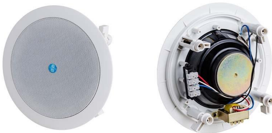
Рис. 1. Внешний вид громкоговорителя.

Внешний вид громкоговорителя показан на рис. 1.