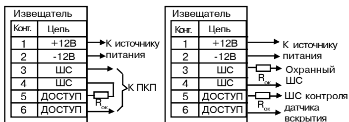
а) б) Рис. 2

• Установите на место крышку извещателя. Для этого выступ на крышке вставьте в паз на наружном кольце основания, нажмите на крышку и поверните по часовой стрелке до упора.