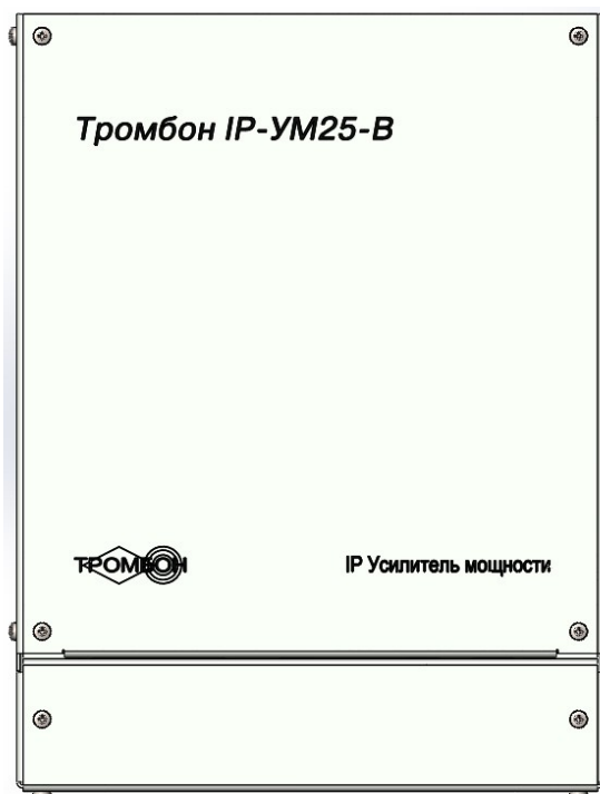
Рисунок 1 - Вид спереди

Снизу усилителя располагается крышка коммутационного отсека, под которым располагаются все элементы коммутации и управления.