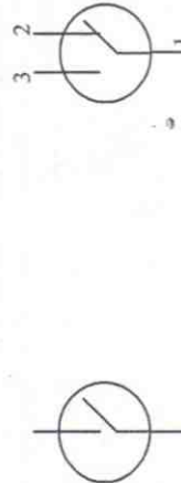
Рис. 3 а