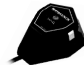
VM-6 11 Вихрь