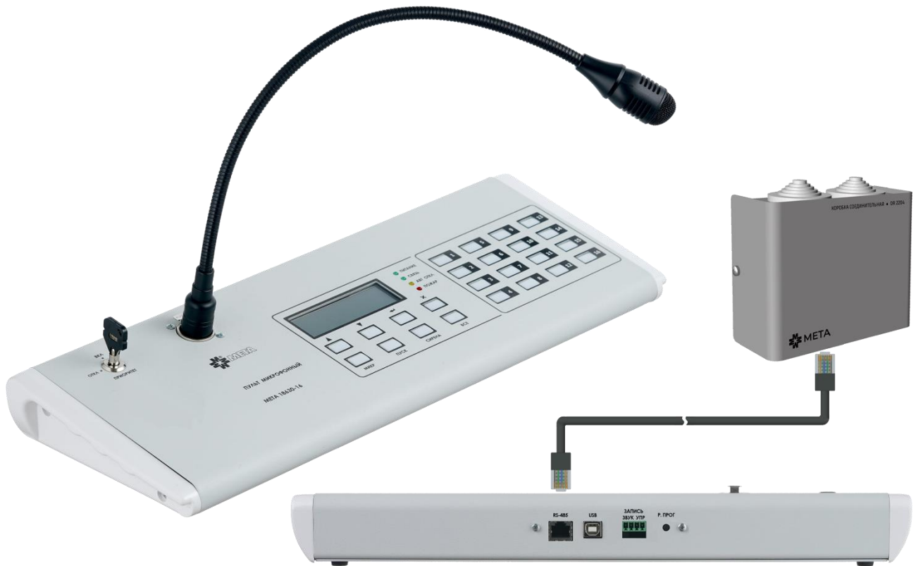
Рисунок 1. Внешний вид МП МЕТА 18630-16 и коробки соединительной DR-2204.