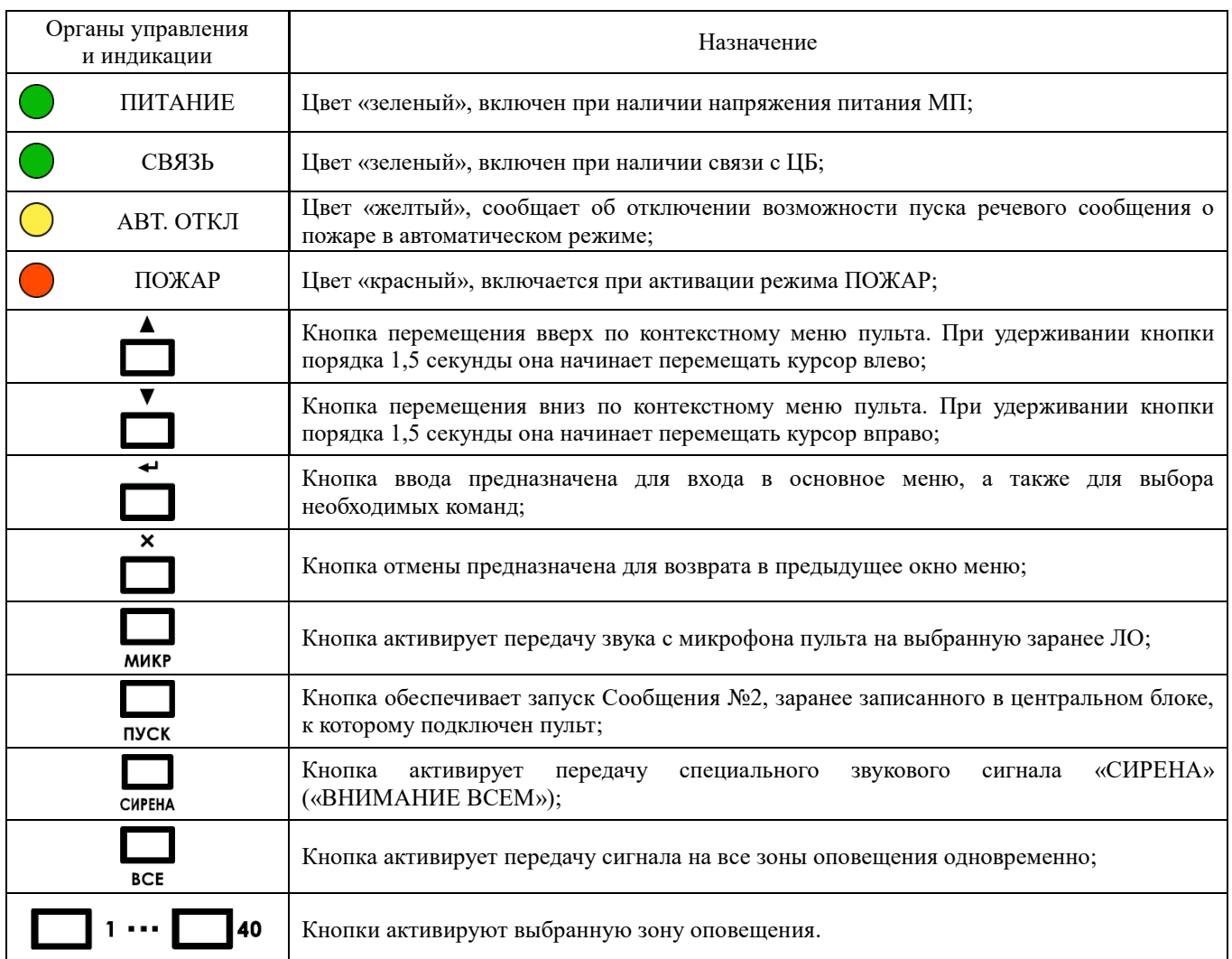
Таблица 2. Назначение органов управления и индикации МП МЕТА 18630-хх.