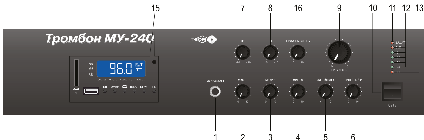
Рис. 1. Вид на переднюю панель усилителя Тромбон МУ-240