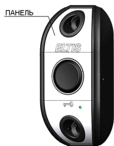
Рис.1 Внешний вид изделия

На рис.1 представлен внешний вид изделия, на рис.2 – схема подключения, на рис.3 показан внешний вид изделия с козырьком, на рис.4 – разметка под установку.