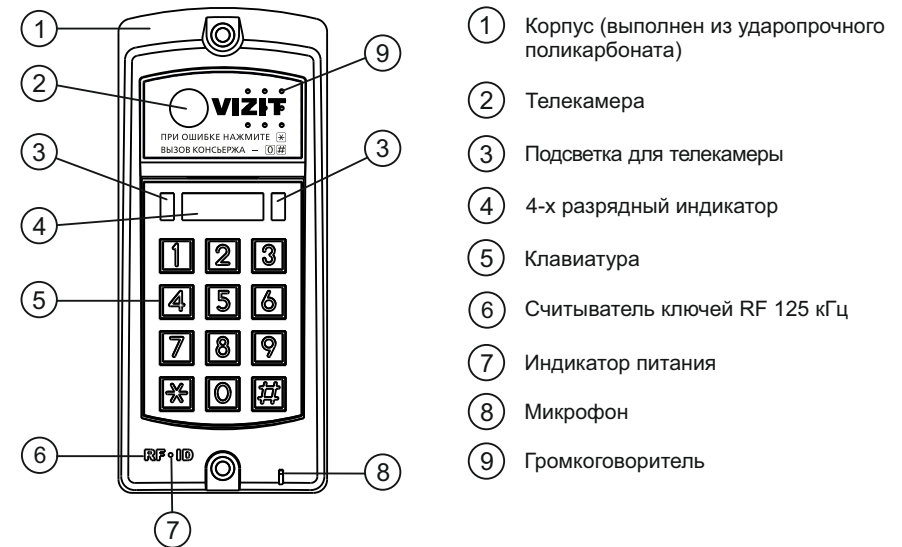
Рисунок 1 - Внешний вид блока

Блок вызова домофона БВД-317RCBW (в дальнейшем - блок вызова) используется совместно с блоками управления БУД-302М, БУД-302S, БУД-302К-20, БУД-302К-80, БУД-302S-20, БУД-302S-80, БУД-430, БУД-430М, БУД-430S, БУД-485, БУД-485М и БУД-485Р как составная часть многоквартирных домофонов и видеодомофонов VIZIT (серии 300, 400).