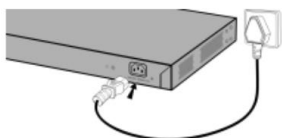
Подключение питания АС 100~240В