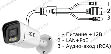
Рис.1 Схема подключения видеокмеры