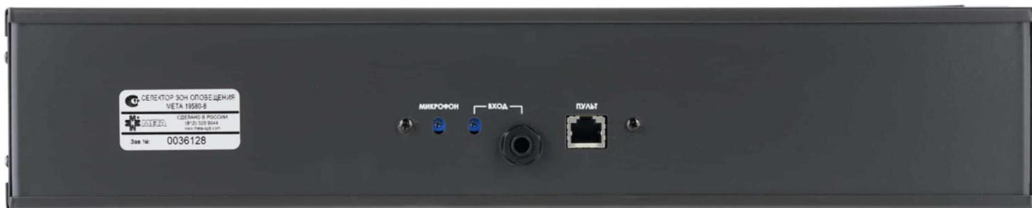
Рисунок 2. Внешний вид задней панели СЗО.

2.11 На всех модификациях задней панели СЗО расположены следующие разъемы: