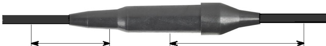
Рис. 4. Участки на оболочках кабелей и на муфте, которые должны быть обезжирены и зачищены.

Внимание! Не следует применять для обезжиривания бензин, уайт-спирит и иные растворители, которые могут оставлять на поверхности оболочки масляную плёнку.