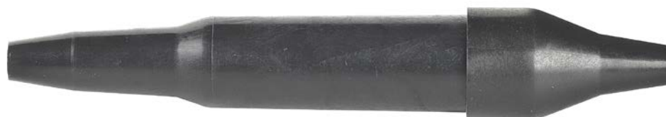
Рис. 1. Внешний вид муфты МПП-0,05.

Внешний вид и элементы муфты представлены на рис. 1 и 2.