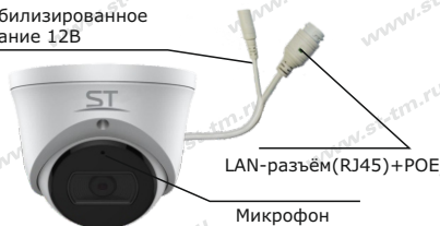
Рис.1 Схема подключения видеокмеры