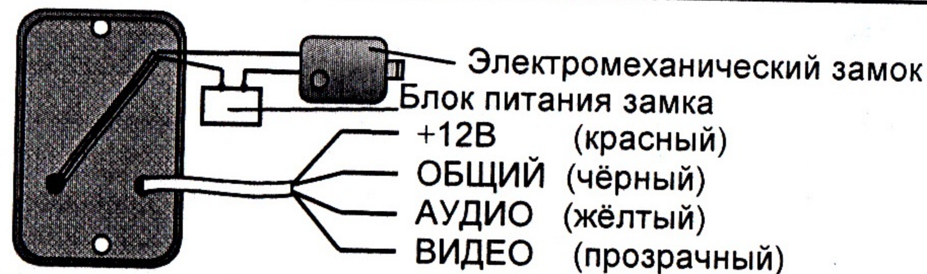
Схема подключения панели JSB-V02M