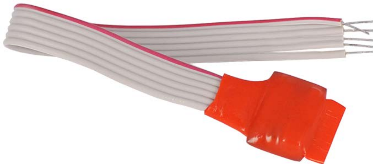
Рисунок 2.2.1 Внешний вид AP1

На рисунке 2.2.1 представлены внешний вид AP1.